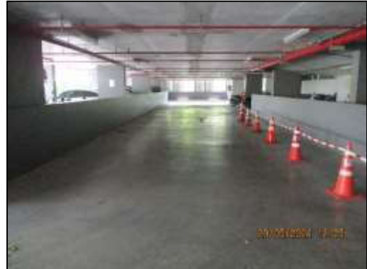
รูปที่ 38 พื้นที่จอดรถ