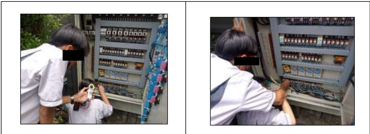
รูปที่ 9 เจ้าหน้าที่ดูแลระบบบำบัด

การปฏิบัติงานตามมาตรการฯ ของโครงการ โครงการ เซียล่า ศรีปทุม (ชื่อเดิมยู ดีไลน์ ศรีปทุม (ระยะดำเนินการ) ของของนิติบุคคลอาคาร ชุด เซียล่า ศรีปทุม