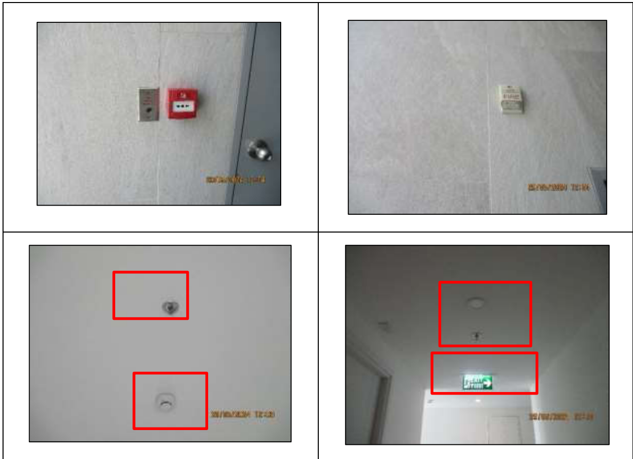
รูปที่ 32 ระบบแจ้งเตือนอัคคีภัย