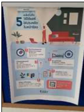
รูปที่ 42 ป้ายประกาศล้างแอร์