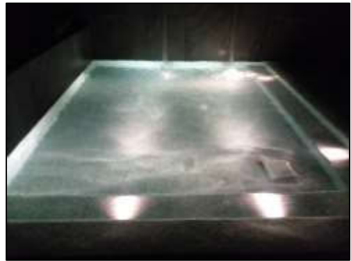
รูปที่ 14 แสงสว่างบริเวณสระว่ายน้ำ