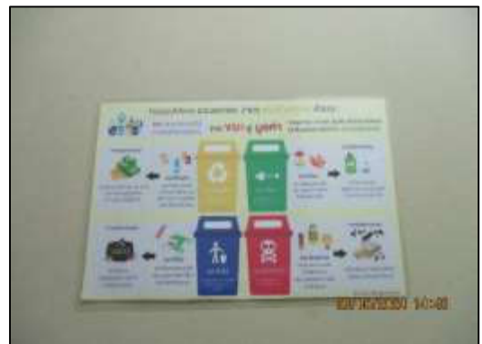
รูปที่ 21 ป้ายรณรงค์คัดแยกขยะ