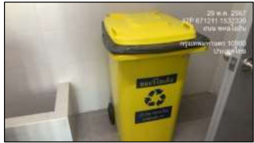
รูปที่ 19 ถังขยะประจำชั้น