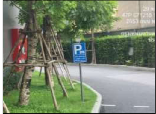
รูปที่ 40 พื้นที่จอดรถสำหรับรับส่ง