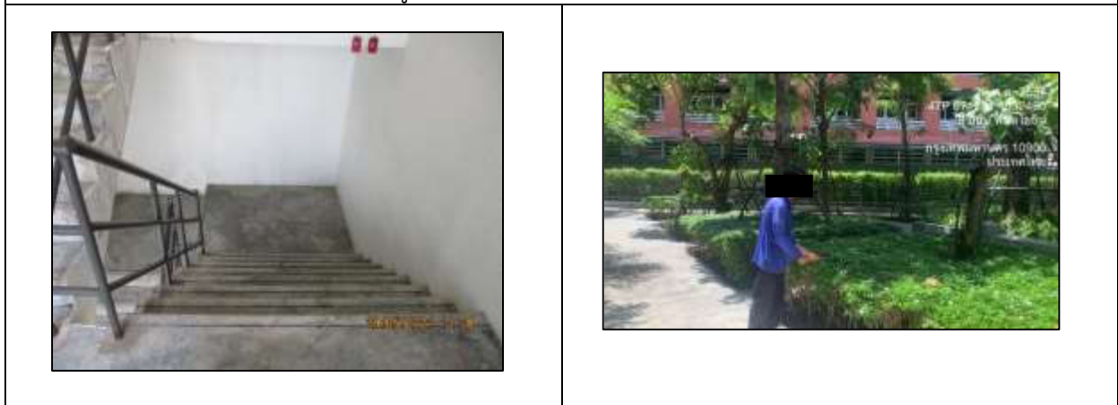
รูปที่ 33 บันไดหนีไฟ