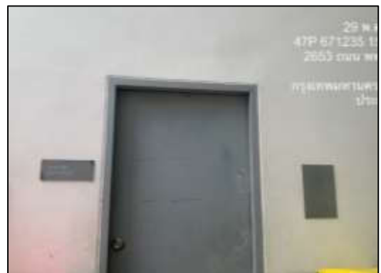
รูปที่ 20 ห้องขยะรวม