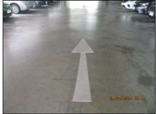
รูปที่ 35 สัญลักษณ์บนพื้นทาง