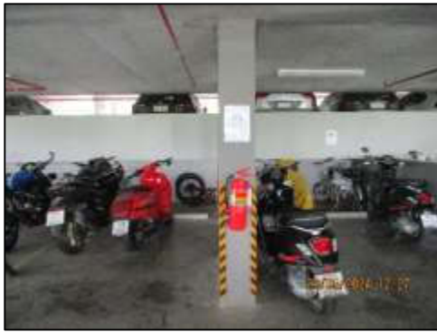
รูปที่ 39 พื้นที่จอดรถสำหรับรถมอเตอร์ไซด์