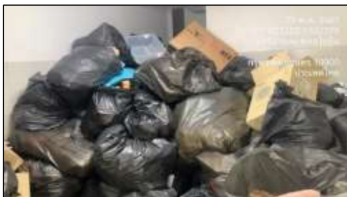
รูปที่ 20 ห้องขยะรวม (ต่อ)