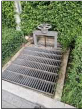
รูปที่ 18 บ่อท่ว่งน้ำ

การปฏิบัติงานตามมาตรการฯ ของโครงการ โครงการ เขียวลำ ศรีปทุม (ชื่อเดิมยู ดีไลน์ ศรีปทุม (ระยะดำเนินการ) ของของนิติบุคคลอาคาร ชุด เขียวลำ ศรีปทุม