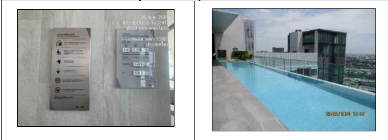
รูปที่ 10 กฎระเบียบสระว่ายน้ำ