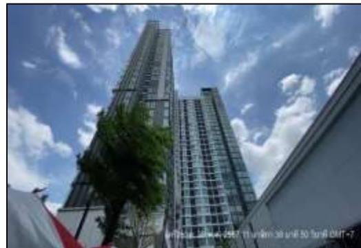
รูปที่ 43 ตัวอาคาร