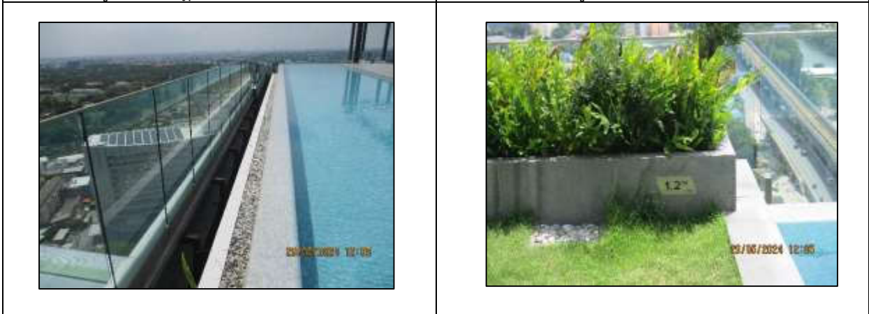
รูปที่12 รางน้ำฝน