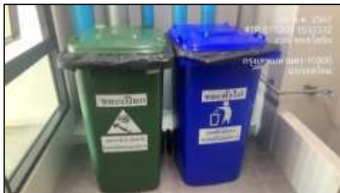
รูปที่ 19 ถังขยะประจำชั้น (ต่อ)